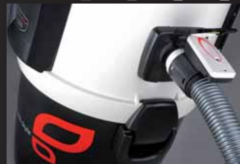
Integrierte Saugdose am Gerät